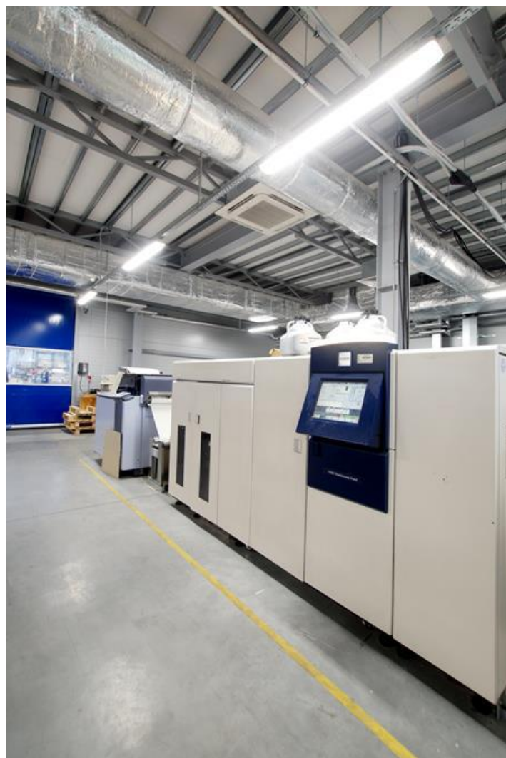
Drukarnia "Print Group", Szczecin

Szczelne oprawy sufitowe z wysokowydajnymi źródłami LED, zapewniające dodatkową ochronę przed penetracją ciał obcych i strumieni wody ze wszystkich kierunków. Doskonale do instalacji w wilgotnych i zapyłonych pomieszczeniach. Oprawa charakteryzuje się kompaktowymi rozmiarami oraz niezwykle łatwym i szybkim sposobem montażu w porównaniu do podobnych produktów. Temperatura barwowa zastosowanych źródeł LED to 3000 K lub 4000 K. Wskaźnik oddawania barw Ra > 80 . Przeznaczenie: oświetlenie hal, magazynów, przejść podziemnych, parkingów itp.